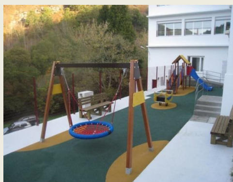
Aire de jeu