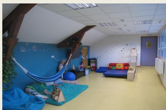
Lieux de vie collective