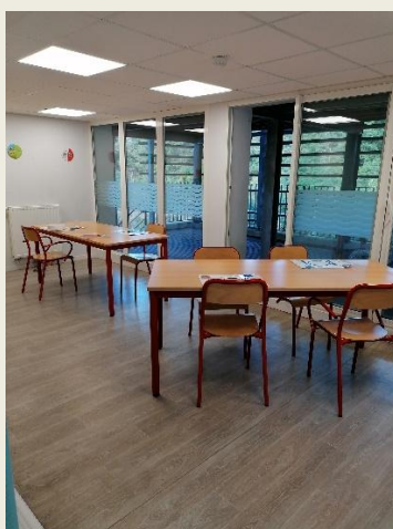
Salle des repas accompagnés