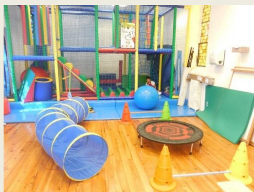
Salle de motricité

Ce catalogue d'activités doit s'inscrire dans un développement éducatif tout en répondant aux besoins et centres d'intérêts de chaque enfant.