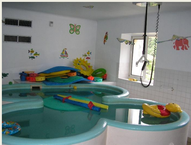
Bassin de balnéothérapie