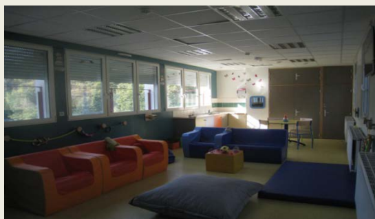
Une salle de jeux