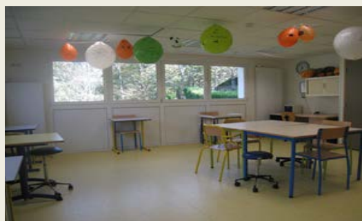
Une salle à manger