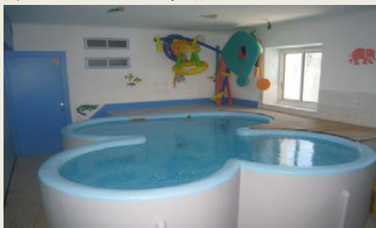
Le bassin de Balnéothérapie