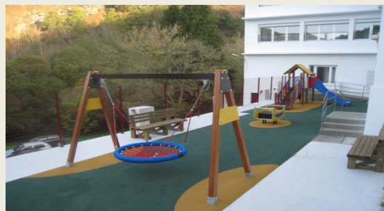
L'Aire de jeux